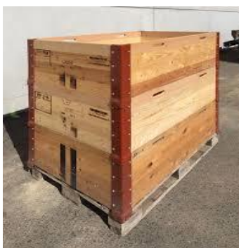
Paletten mit max. 3 Rahmen (wenn nötig mit Auskleidung)