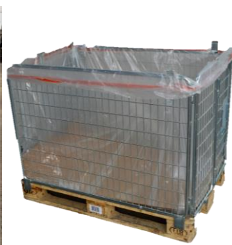
Gitterboxen (wenn nötig mit Auskleidung)